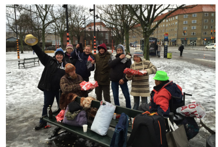
Julen 2014 - Glade mennesker på Hulgårds Plads