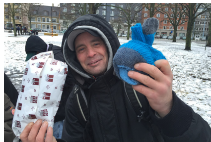
Bo modtager en gave - Rungsted Plads

Flere kvinder fra en af de pladser, som Kørselsteamet ofte besøger har ytret et ønske om at gøre brug af et sådan tilbud. Det samme gør en mandlig bruger, der netop er vendt hjem efter et behandlingsforløb. Samtaletilbuddet vil blive udviklet i